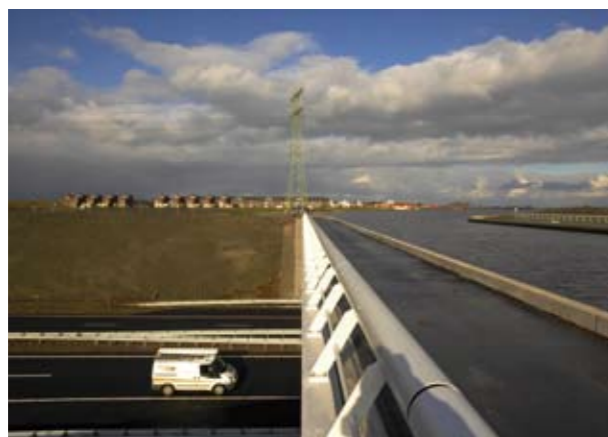
Het thema duurzaamheid daagt ons voortdurend uit om te innoveren en te verbeteren.

Voor vraagstukken op het gebied van klimaatverandering, betaalbaar wonen, afvalmanagement, mobiliteit en energieverbruik heeft Dura Vermeer een aantal beproefde concepten en producten ontwikkeld waarmee opdrachtgevers hun duurzame doelstellingen kunnen realiseren.